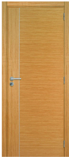
M14 CARVALHO COMP.