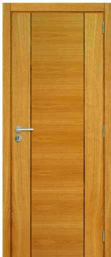
I18 CARVALHO USA|NOGUEIRA