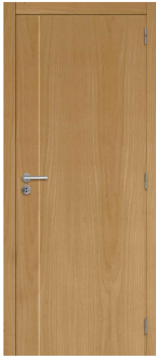
F11 FAIA VAP.