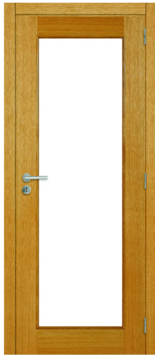
A1RDV1A B1 CARVALHO USA